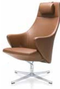
Nackenkissen Neck cushion Coussin de nuque