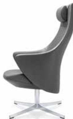
AA 990.65 (Nackenkissen, neck cushion, cousin de nuque)