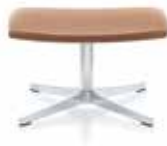
Loungestuhl Lounge stool Tabouret de salon

Choose accessories articles / Choisissez les accessoires articles