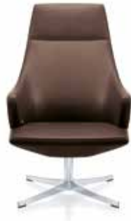
Relaxessel Lounge chair Fauteuil de salon